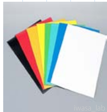
iwasa_lab マグネットシート